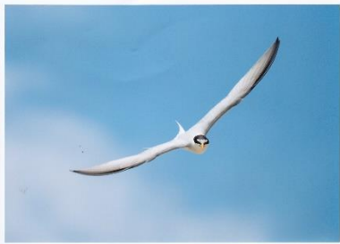
コアジサシ [小鯨刺]