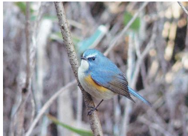
ルリビタキ [瑠璃鶺鴒]